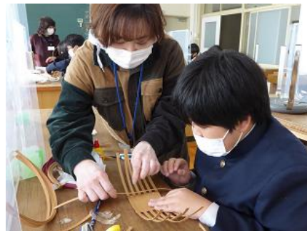
地域の方に学ぶ「交流会」